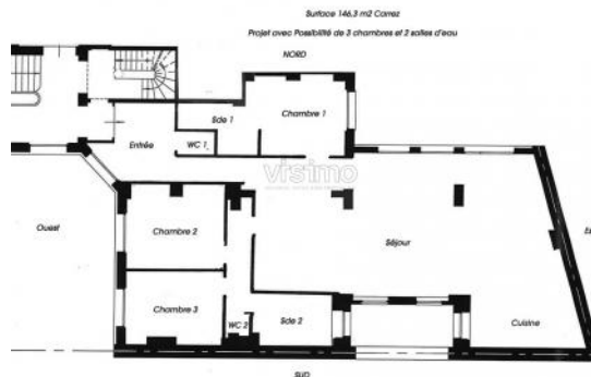
2ème ETAGE - CONFIG 3 CHAMBRES