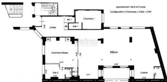
2ème ETAGE - CONFIG 2 CHAMBRES