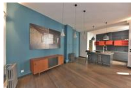
SALE à MANGER