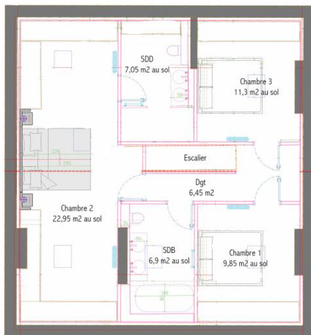
4ème Etage sans Ascenseur