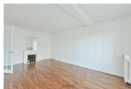
CHAMBRE 3 OU BUREAU