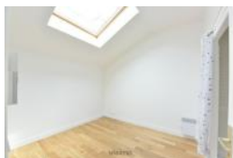
visimo CHAMBRE 3