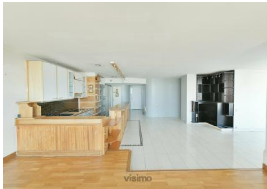
SÉJOUR ET CUISINE