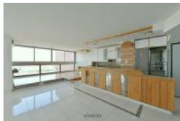
SÉJOUR ET CUISINE